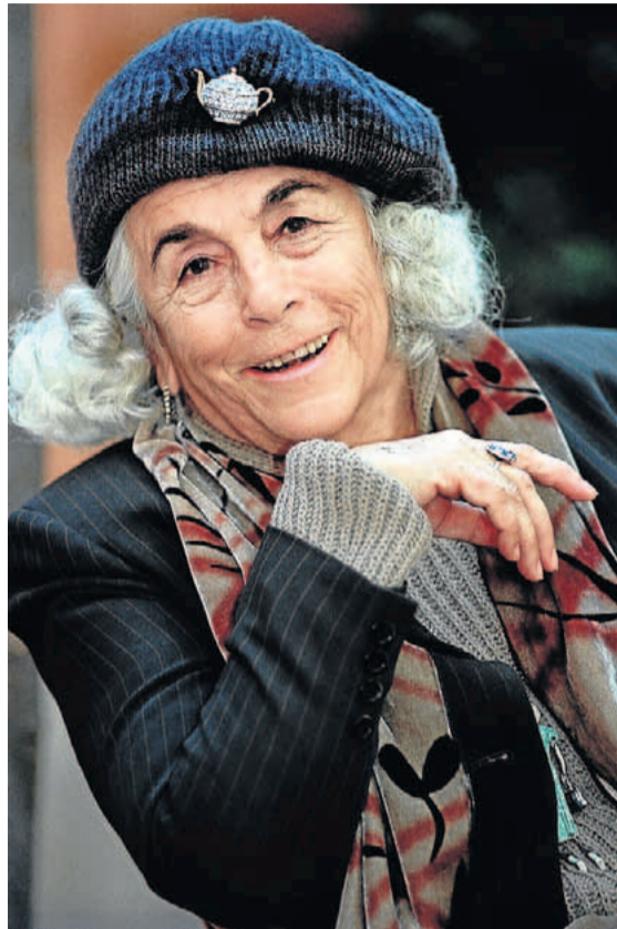
Carmen Martín Gaité.